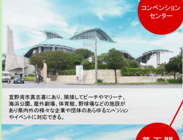
コンベンション センター

観光スポットとしておなじみの北谷町美浜から車で約5分。サンエーハンバータウンの向かいにあり、周辺にはフリーマーケットやレストランなどお楽しみスポット満載！！