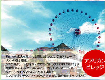
アメリカン ビレッジ

1416年-1422年に護佐丸(ごさまる)が受城したグスク(城)であるとされている。城門のアーチに楔石を用いており、アーチ門では古い形態とされる。ロケーションもよく、近くには米軍陸軍通信所・通称「象のオリ」も一望できます。