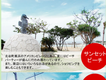
サンセット ビーチ

約11haの広大な敷地に出現したショッピング&アミューズメントの複合施設。8つのスクリーンを持つシネマコンプレックス「PLEX1」や大観覧車のあるカーニバルパークを擁する。また、周辺にはいろいろなお店があるので、ショッピングを楽しむこともできます。